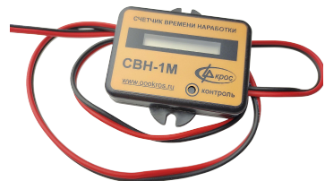
Счётчик времени наработки