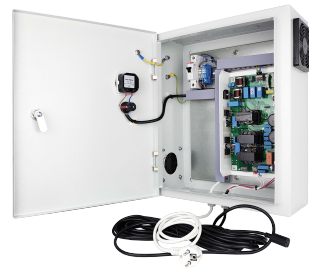
Шкаф питания на 1 ЭПРА