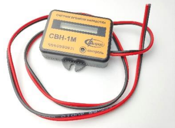
Счетчик времени наработки