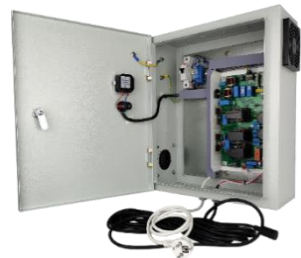
Шкаф питания на 1 ЭПРА