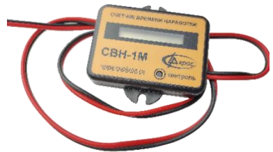
Счётчик времени наработки