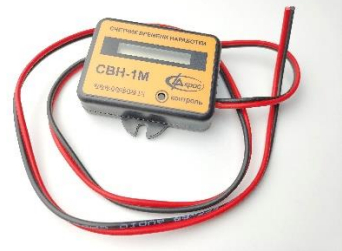
Счетчик времени наработки