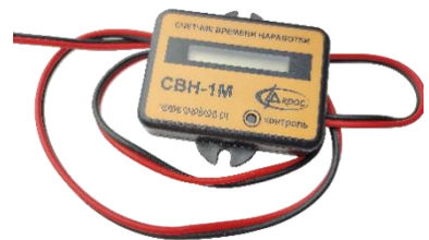
Счётчик времени наработки