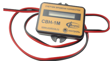
Счётчик времени наработки