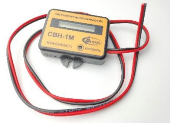
Счетчик времени наработки