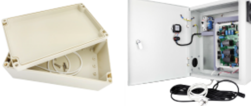
Гермобокс / Шкаф питания