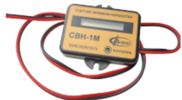
Счётчик времени наработки